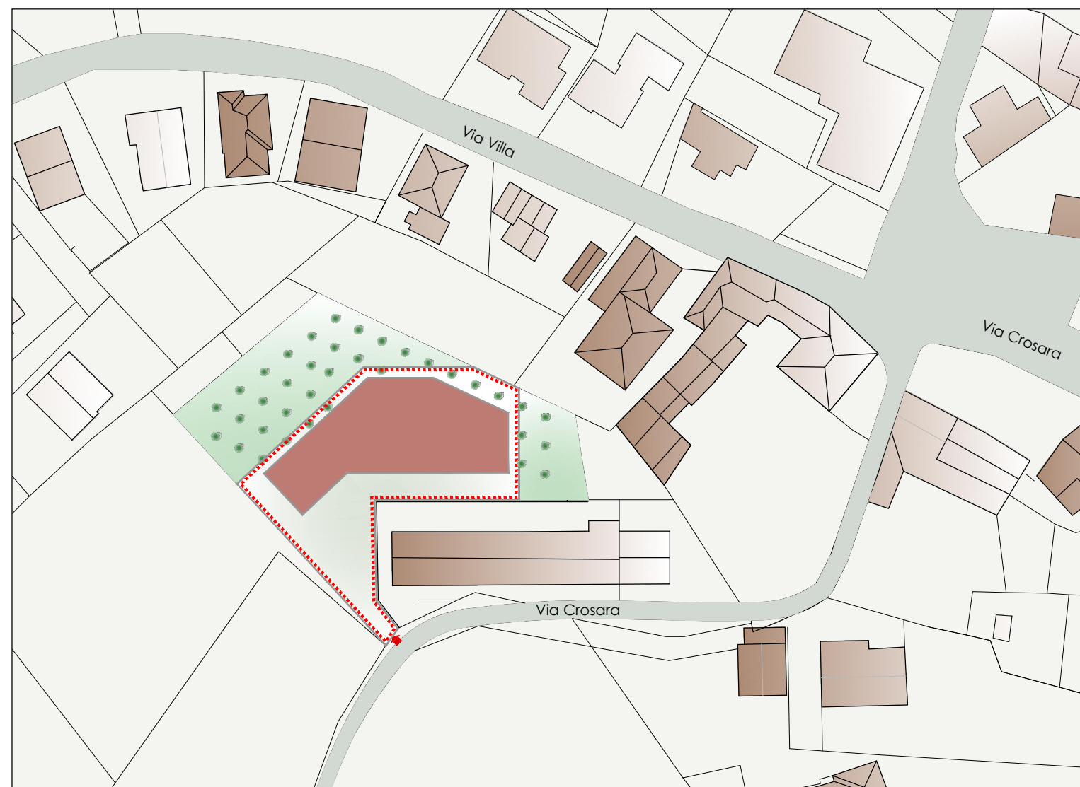
RILIEVO CON PIANO QUOTATO ESISTENTE SCALA 1:250